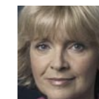
Barbara Sommer Ministerin für Schule und Weiterbildung des Landes NRW