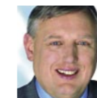
Karl-Josef Laumann Minister für Arbeit, Gesundheit und Soziales des Landes NRW

Wir freuen uns, dass mit dieser Veranstaltung für unser Land eine Plattform geboten wird, die nicht nur den Dialog ermöglicht, sondern auch zeigt, was sich in NRW schon tut und wie wir unser überaus erfolgreiches System der dualen beruflichen Ausbildung für Gegenwart und Zukunft noch besser machen können. Dazu wünschen wir allen Teilnehmerinnen und Teilnehmern viel Erfolg.